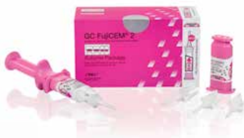
GC FujiCEM 2 Automix