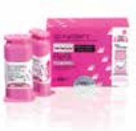
GC FujiCEM 2 SL Refill