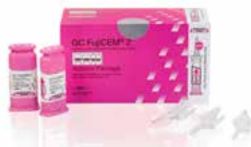
GC FujiCEM 2 SL Automix