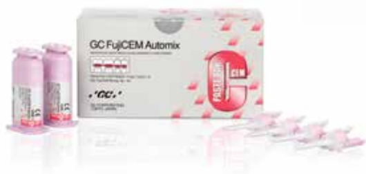
GC FujiCEM Automix