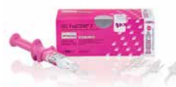
GC FujiCEM 2 SL Automix Starter kit avec GC FujiCEM 2 Dispenser

GC EUROPE N.V. Head Office Researchpark Haasrode-Leuven 1240 Interleuvenlaan 33 B-3001 Leuven Tel. +32.16.74.10.00 Fax. +32.16.40.48.32 info.gce@gc.dental http://www.gceurope.com