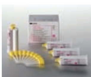
Express™ 2 Light Body Standard Quick Boîte Standard