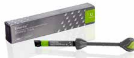
Essentia Universal Composite de restauration universel

everX Flow, Essentia, G-Premio BOND et G-ænial Universal Injectable sont des marques déposées de GC. Filtek Bulk Fill Flowable, SDR flow+ et Tetric EvoFlow Bulk Fill ne sont pas des marques déposées de GC.