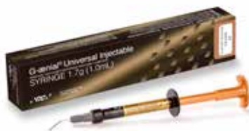
G-ænial Universal Injectable Composite de restauration injectable haute résistance