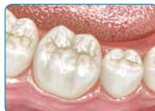
Résultat final après recouvrement par un composite conventionnel