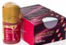
G-Premio BOND Adhésif universel