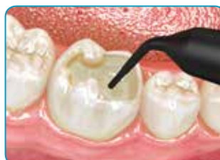
Remplir la cavité d'everX Flow