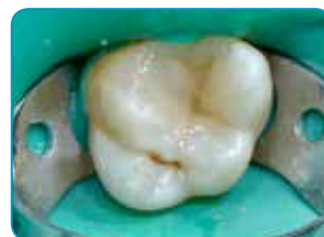
Couche finale de G-aenial Universal Injectable (teinte A3)