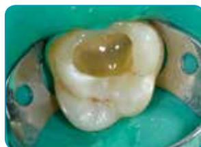
Application de l' everX Flow (Teinte Bulk)