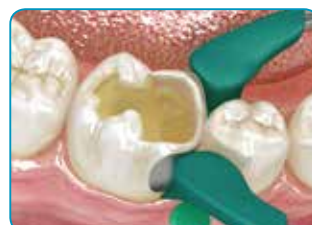
En cas de cavité de classe II, réaliser la paroi manquante avec un composite