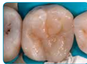
Couche finale d' Essentia (teinte Universal)