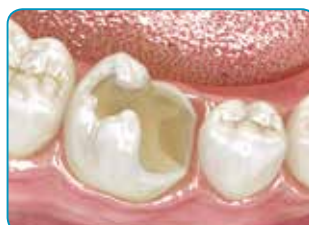
Préparer la cavité

Teinte Dentine pour des résultats plus esthétiques