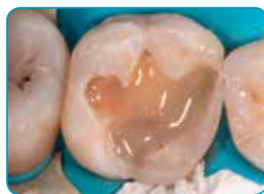
Application de l' everX Flow (teinte Dentine)