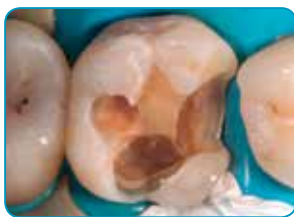
Préparation de la cavité