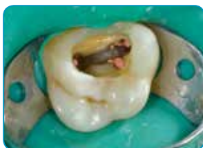
Préparation de la cavité