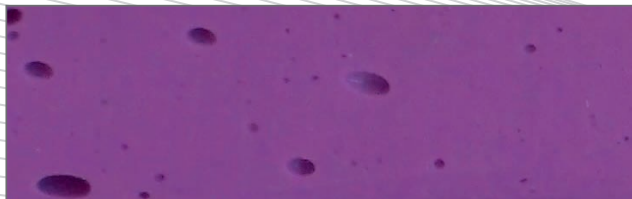
Agrandissement d'un mélange manuel d'alginate