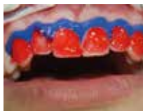
Joint d'étanchéité de la digue autour d'une dent